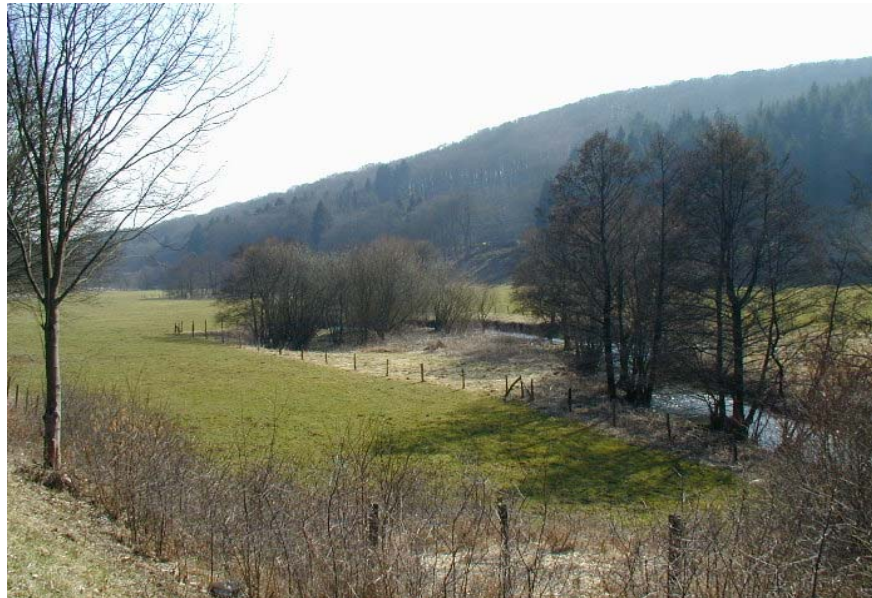
Uferrandstreifen ein Jahr nach der Auszäunung im März 2003