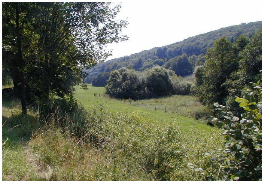
Uferrandstreifen ein Jahr nach der Auszäunung im August 2003