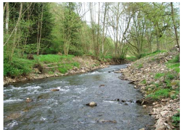
Gewässerabschnitt unterhalb des ehemaligen Wehres im Mai 2004 (linkes Bild ) und im Mai 2005 (rechts Bild)