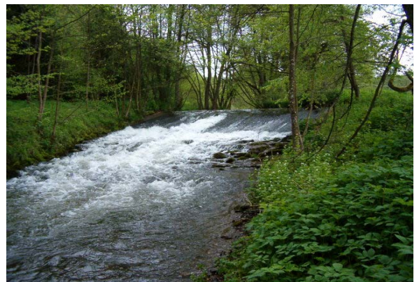
Das Wehr der Lommersdorfer Mühle im Juli 1991 (linkes Bild) und im Mai 2004 (rechtes Bild)