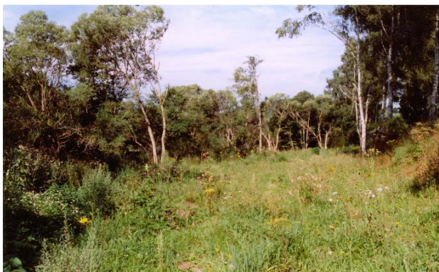
Sukzessionfläche September 1997