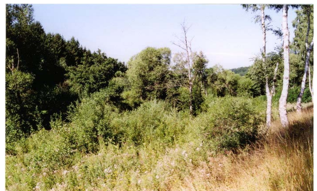
Sukzessionfläche August 2001