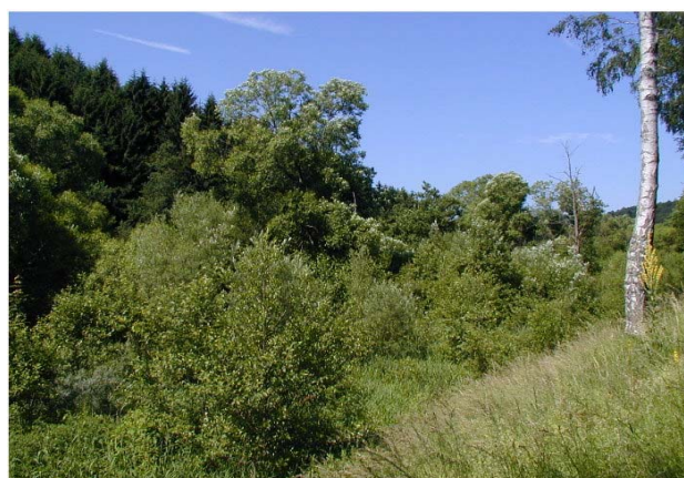
Sukzessionfläche Juni 2003