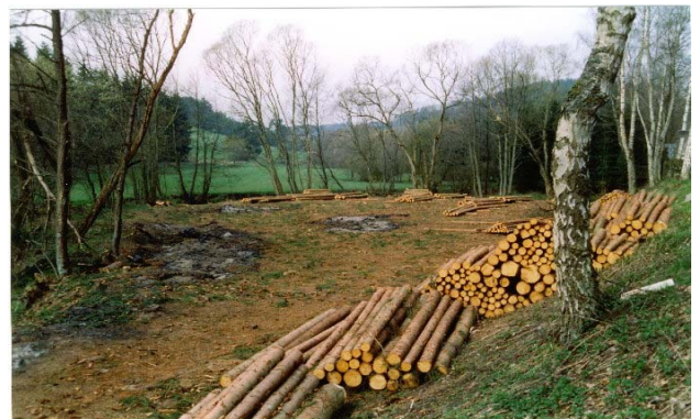
Nach der Entnahme der Fichten im Winter 1996/1997 wurde die Fläche der Sukzession überlassen.