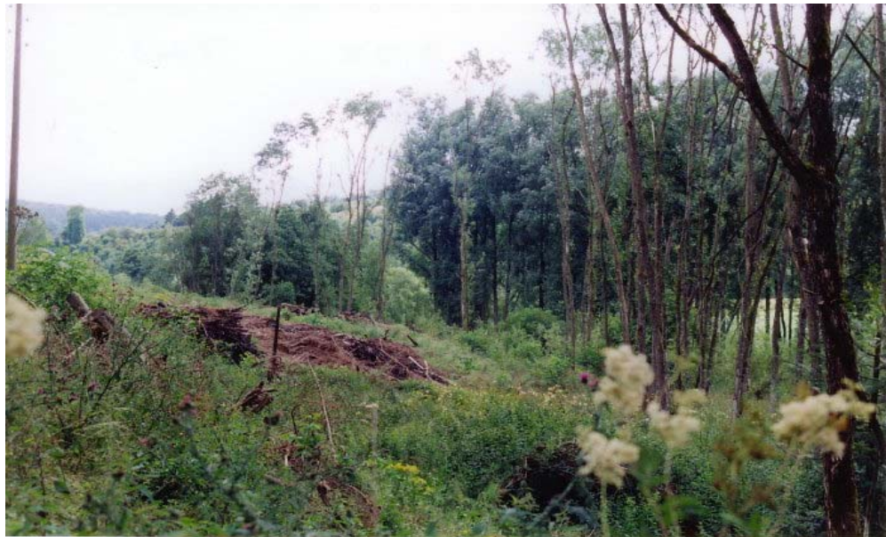
Maßnahmenfläche im August 1998

Nach der Entnahme der Fichten im Winter 1997/98 wurde die Fläche der Sukzession überlassen.