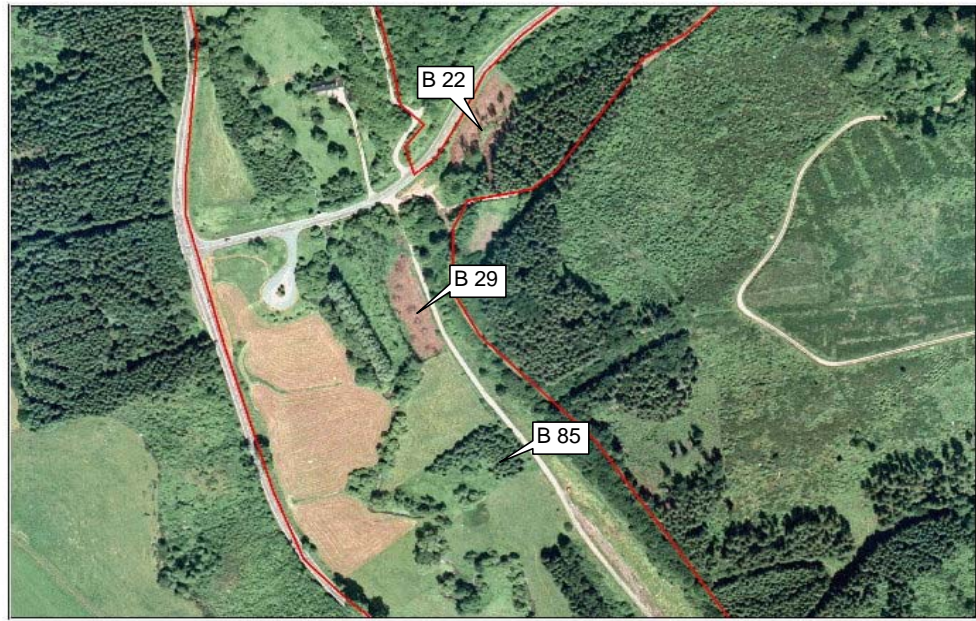
Ahr / Reetzer Bach - Luftbild 1998