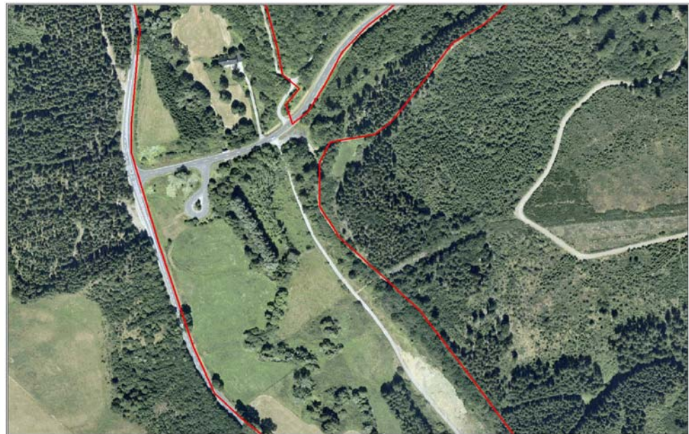
Ahr / Reetzer Bach - Luftbild 2003