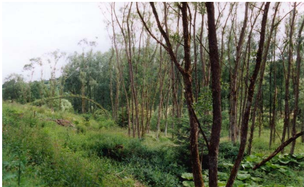
Maßnahmenfläche im August 1999