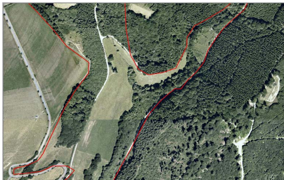
Aulbach - Luftbild 2003