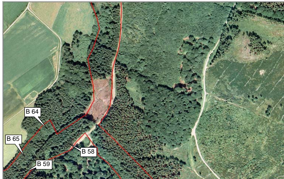
Aulbach - Luftbild 1998