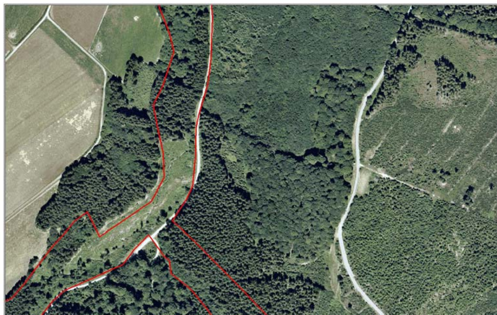
Aulbach - Luftbild 2003