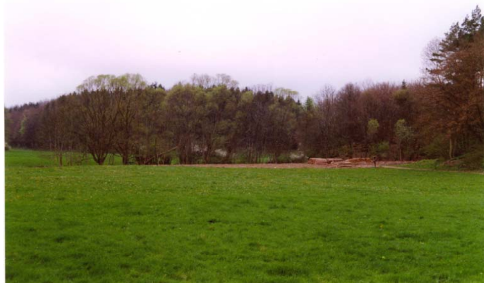
Fläche nach der Fichtenbeseitigung Anfang Mai 1998