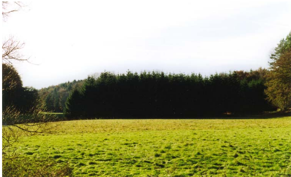
Fläche vor Maßnahmenbeginn, die Entnahme der Fichten erfolgte im Winter1997/98