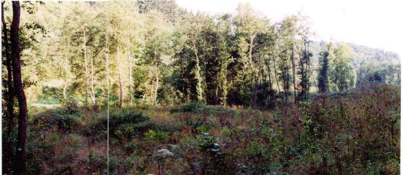
Teilbereich der Maßnahmenflächen im August 2000