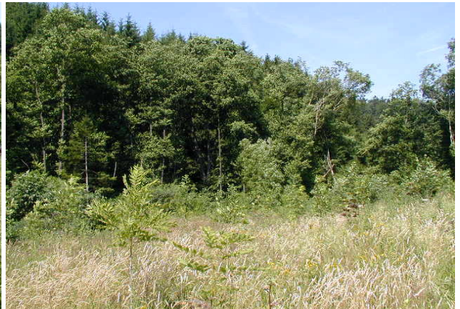
Teilbereich der Maßnahmenflächen im Juli 2002