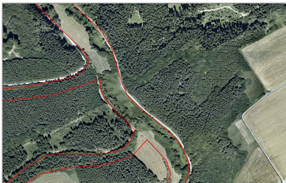
Michelsbach - Luftbild 2003