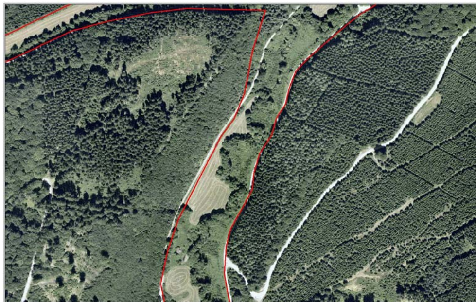
Michelsbach - Luftbild 2003