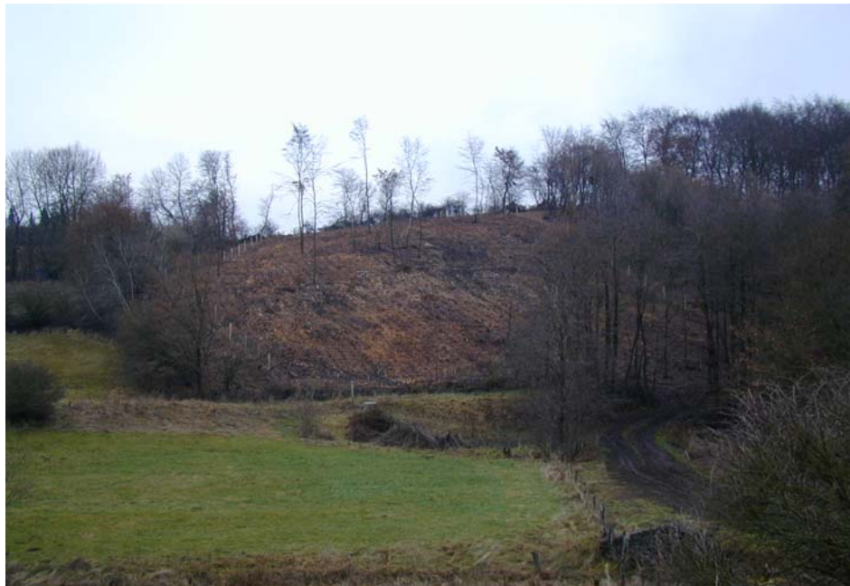
Maßnahmenfläche nach der Entnahme der Fichten und erfolgter Anpflanzung von Traubeneiche und Hainbuche im Dezember 2004