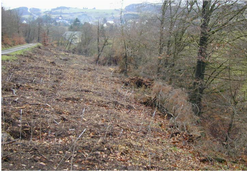
Maßnahmenfläche nach der Entnahme der Fichten und erfolgter Anpflanzung mit Bergahorn im Dezember 2004