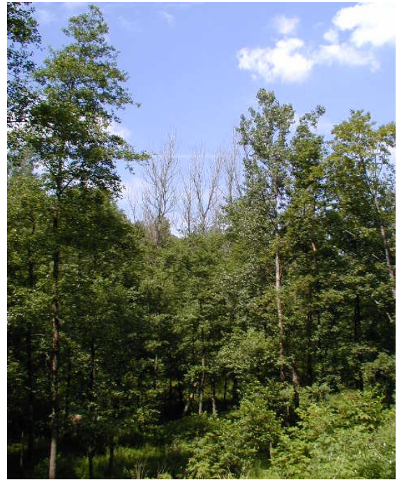
Die abgestorbenen Hybridpappeln im August 2002