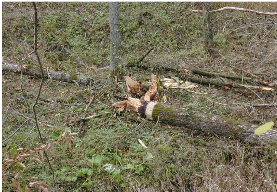
Ein Teil der geringelten Pappeln ist bei den Herbststürmen 2002 umgefallen.