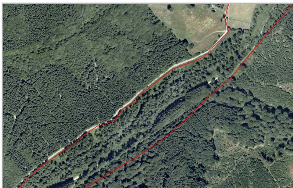
Mülheimer Bach - Luftbild 2003