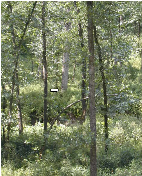
Zur Erhöhung des Totholzanteiles wurde ein Drittel der Hybridpappeln im August 2000 geringelt.