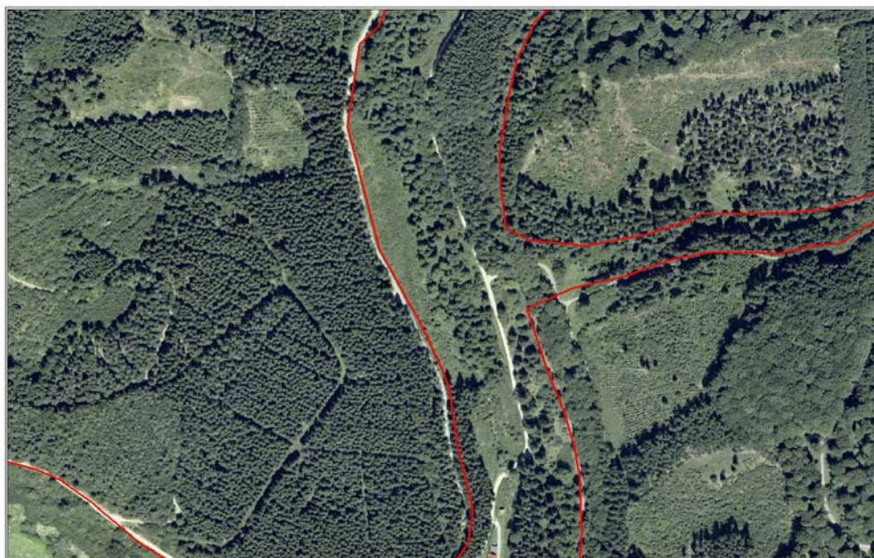
Mülheimer Bach - Luftbild 2003