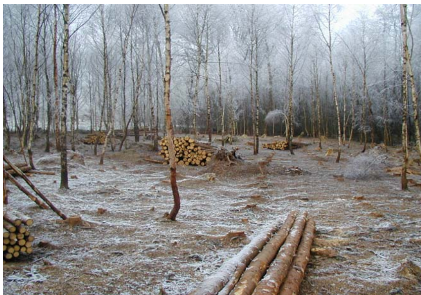
Teilbereiche der Maßnahmenfläche nach der Entnahme der Fichten im Dezember 2004