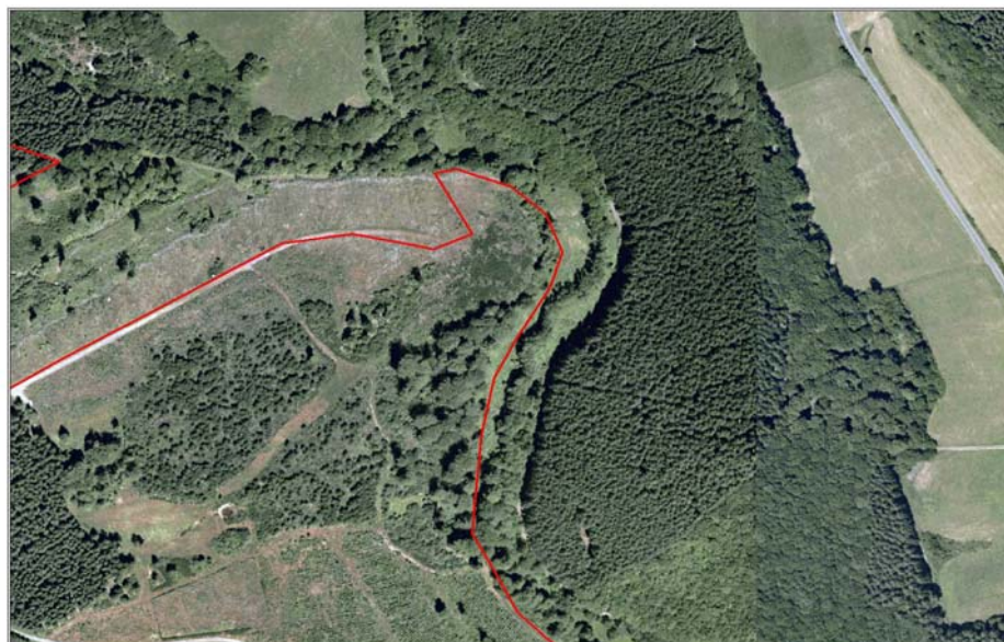
Seidenbachtal - Luftbild 2003