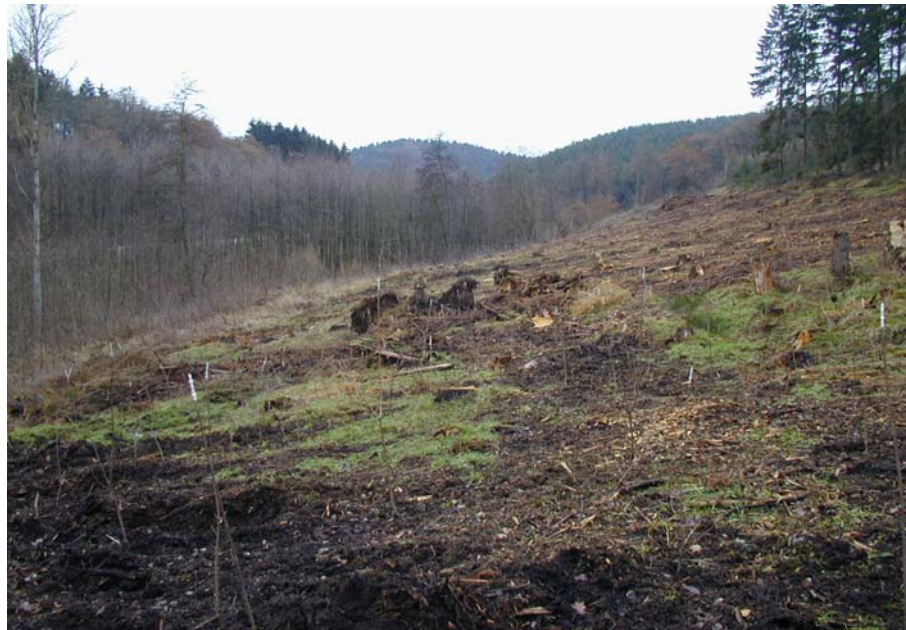
Maßnahmenfläche nach der Entnahme der Fichten und erfolgter Anpflanzung von Bergahorn im Dezember 2004