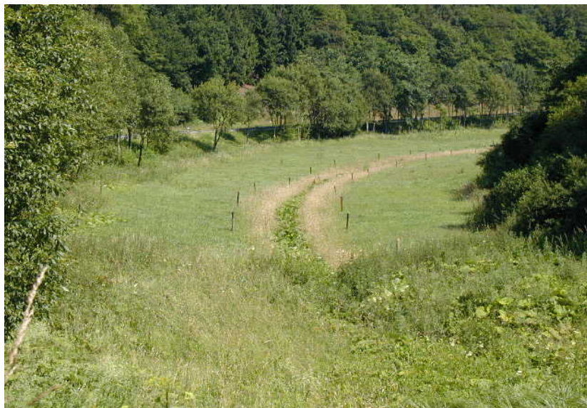
Uferrandstreifen ein Jahr nach der Auszäunung