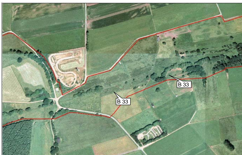
Itzbach - Luftbild 1998