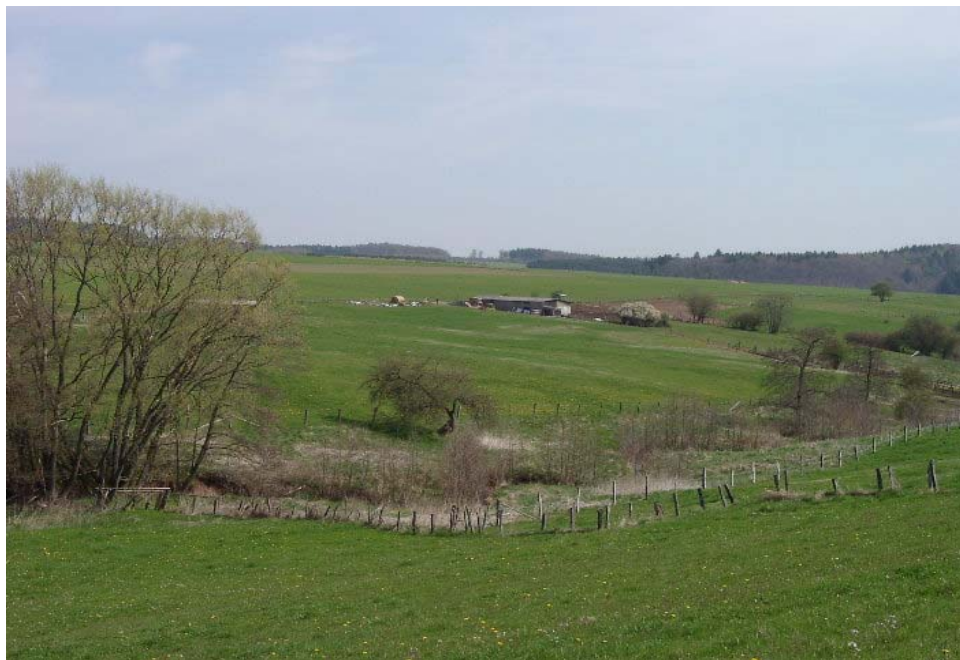
Uferrandstreifen im April 2004