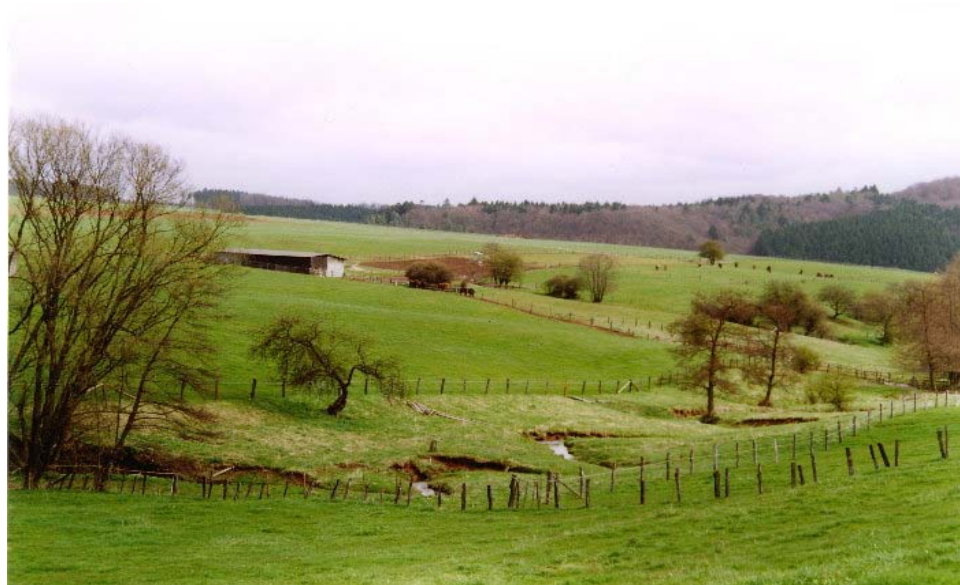
Nach der Auszäunung im Frühjahr 1998 wurde der Uferrandstreifen der Sukzession überlassen, das Bild zeigt den Uferrandstreifen im April 1999