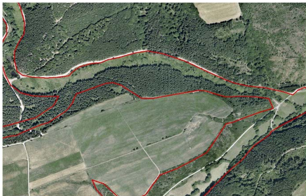
Dreisbachtal - Luftbild 2003