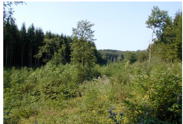
Maßnahmenflächen im August 2002 (linkes Bild) und im August 2003 (rechtes Bild)