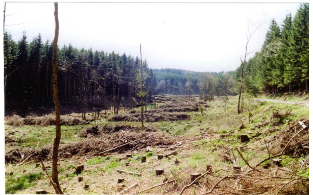
Maßnahmenflächen im Juni 1999 (linkes Bild) und im April 2000 (rechtes Bild)