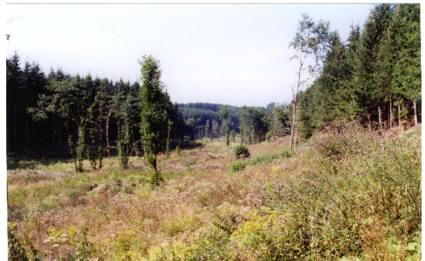
Maßnahmenflächen im August 2000