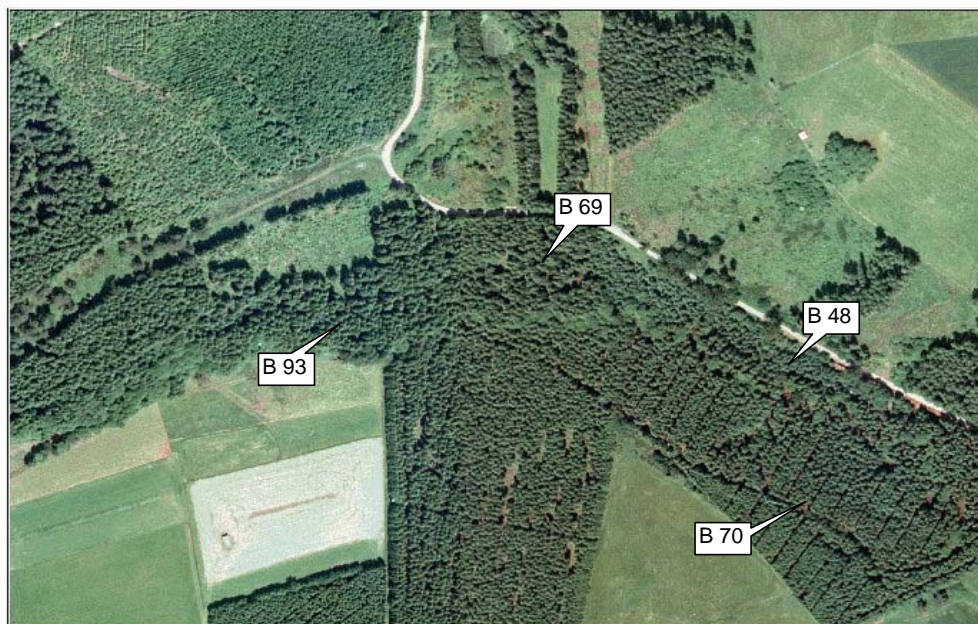
Eichholzbach - Luftbild 1998