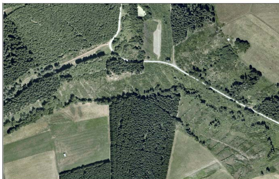
Eichholzbach - Luftbild 2003