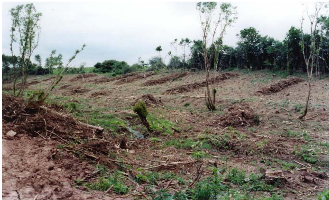
Maßnahmenfläche im Juni 1999

Nach der Entnahme der Fichten im Winter 1998/99 wurde der Schlagabraum zu Wällen zusammengezogen, die dazwischen liegenden Bereiche wurden im Frühjahr 1999 mit Roterle, Esche, Bergahorn und Vogelkirsche bepflanzt.