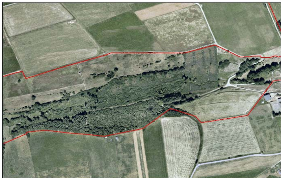
Itzbach - Luftbild 2003