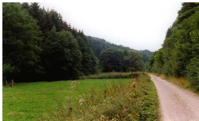
Maßnahmenfläche im August 1999