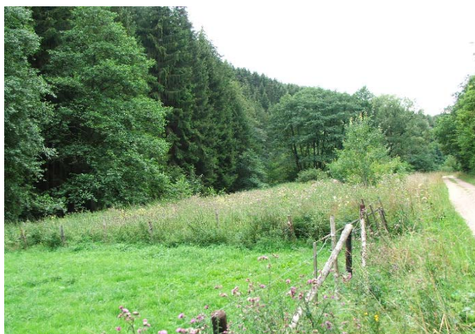
Maßnahmenfläche im August 2006