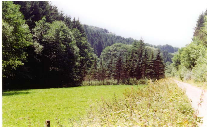
Fläche vor Maßnahmenbeginn, Entnahme der Fichten im Winter 1998/99, Abbau des Betonzauns im Frühjahr 2004