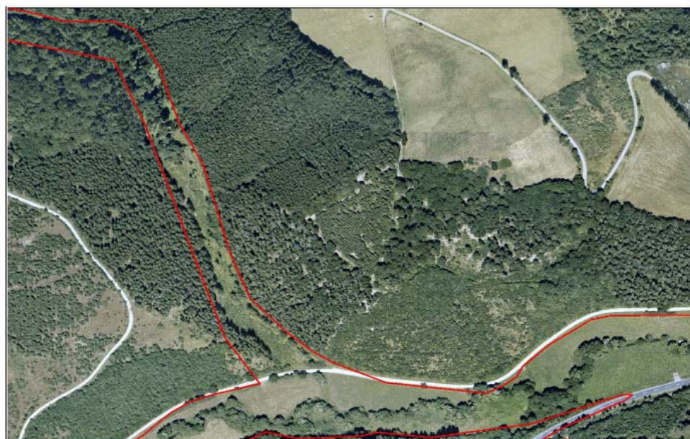
Dedersbach - Luftbild 2003