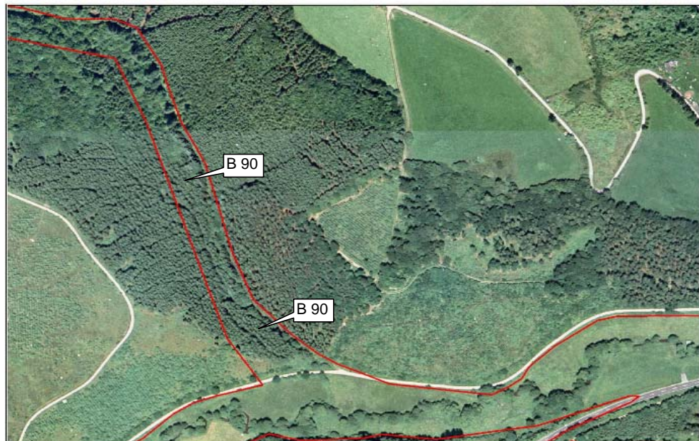
Dedersbach - Luftbild 1998