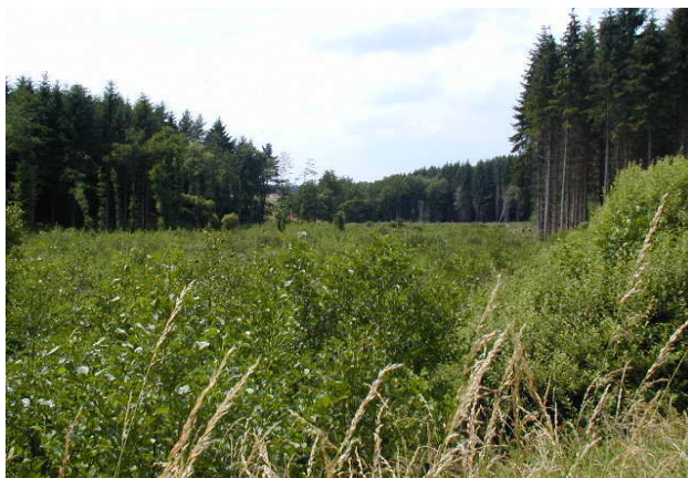
Maßnahmenflächen B 69 und B 93 im Juli 2002