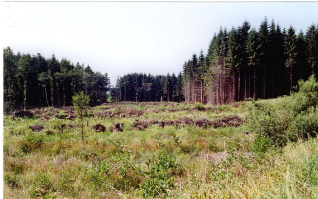
August 2000: Maßnahmenfläche B 69 (Vordergrund) und Fläche B 93 (Hintergrund Bildmitte) vor Maßnahmenbeginn