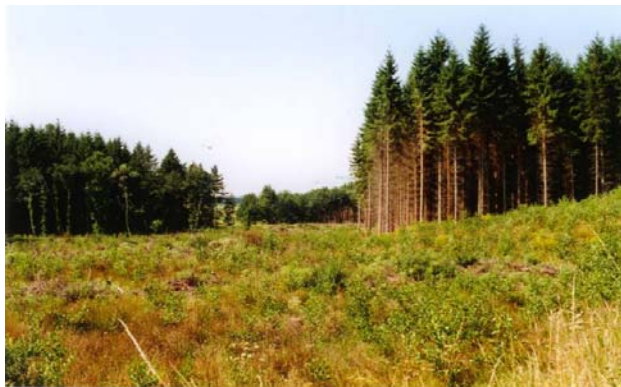
Maßnahmenflächen B 69 und B 93 im August 2001