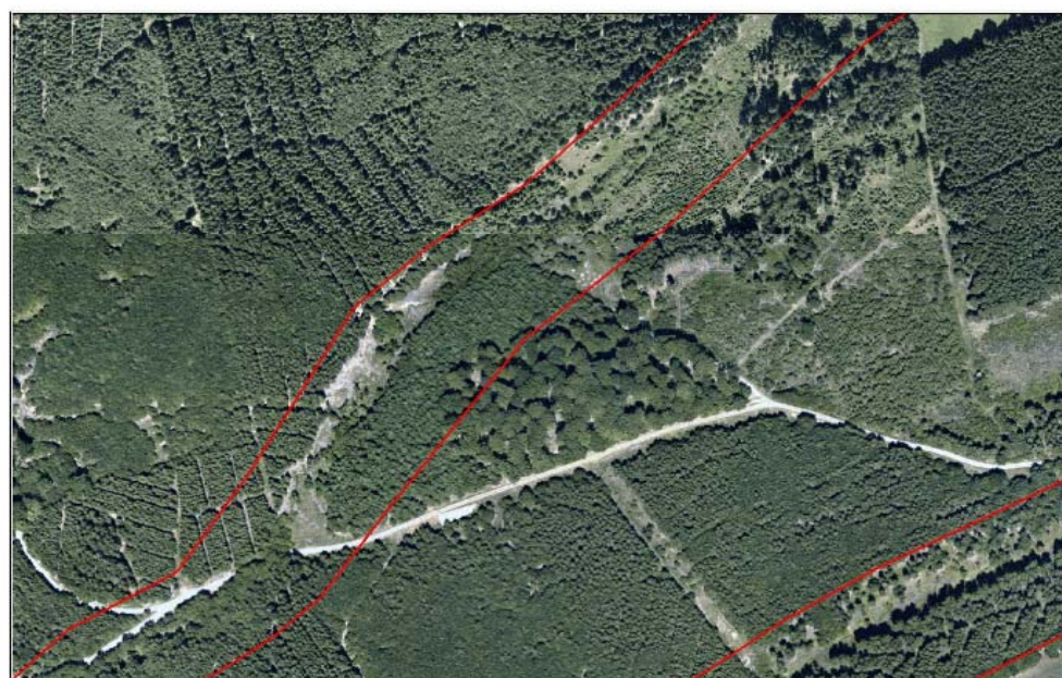
Mäusbach - Luftbild 2003